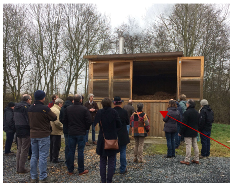
Silo de plaquettes de 30m 3

Chaufferie bois entièrement externalisée et reliée aux anciennes chaufferies par des tuyaux pré-isolés