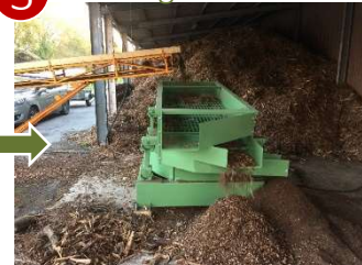
Dépoussiérage et élimination des longs morceaux

Le combustible ainsi produit alimente la chaudière du Moulin de la Hunelle, ainsi que d'autres chaudières des environs