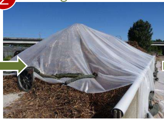
Séchage solaire et forcé avec la chaudière bois