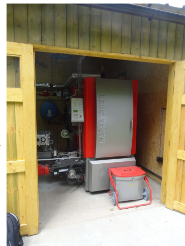
Chaudière de 200 kW